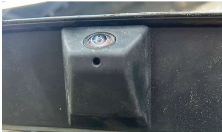
Фото 2. Нижняя камера