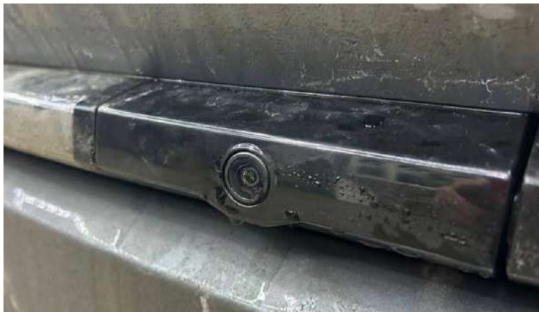
Фото 1. Верхняя камера