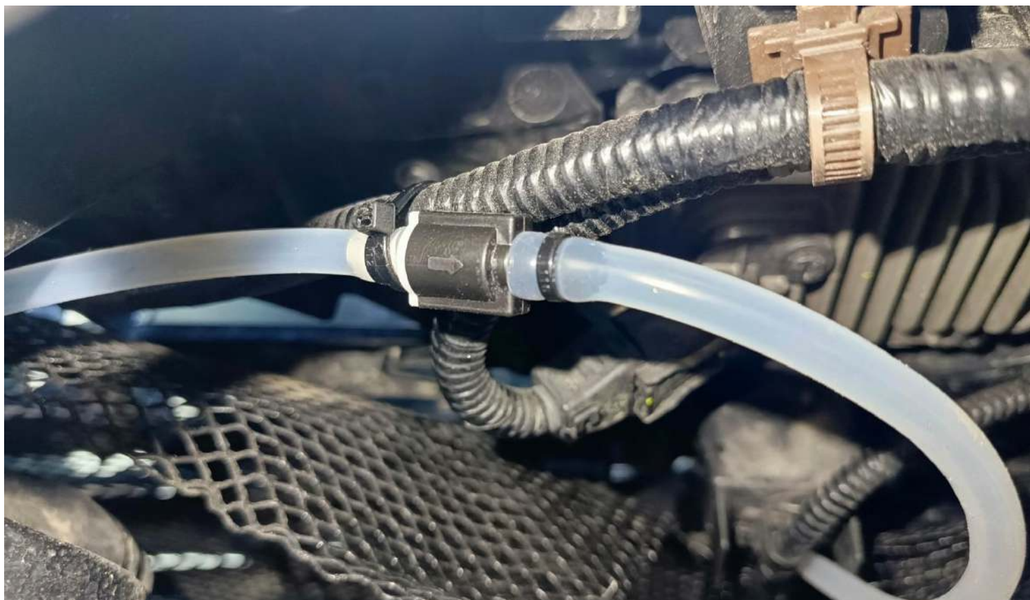
Рисунок 5 7